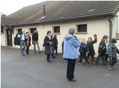
La escuela de Pamfou