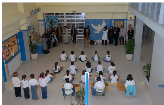
Los alumnos tocan la canción turca