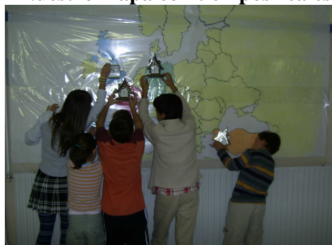
Nuestro mapa con tiempos reales