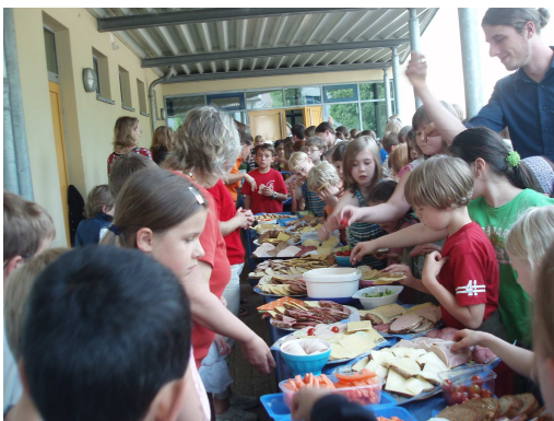
Día del almuerzo saludable