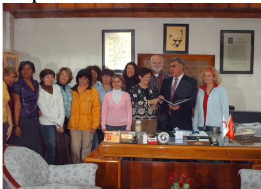
Grupo internacional de maestros