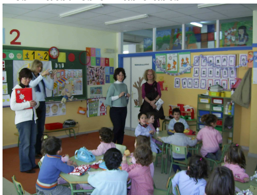
Los maestros en las clases